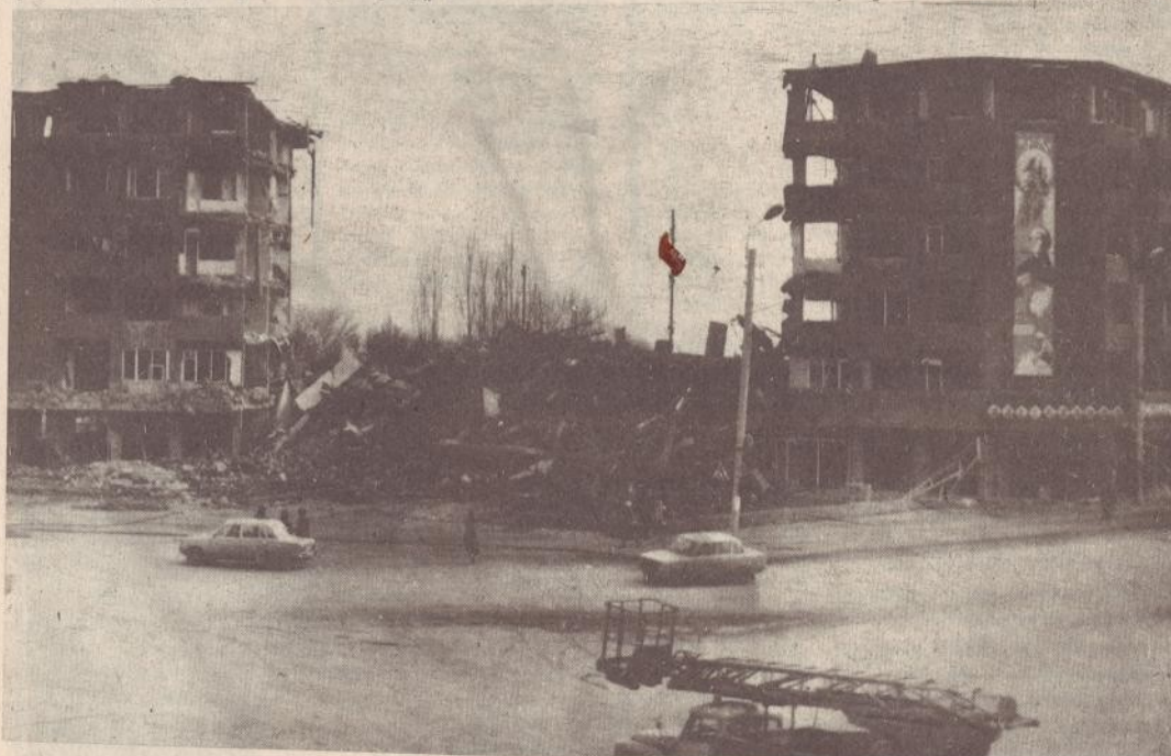
Ավիաժամայինները Հեղափոխության հրապարակում: