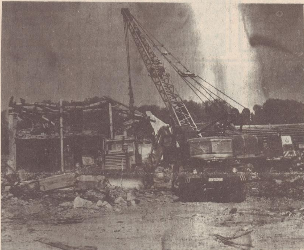
Էլեկտրատեխնիկական գործարանը աղետից հետո: