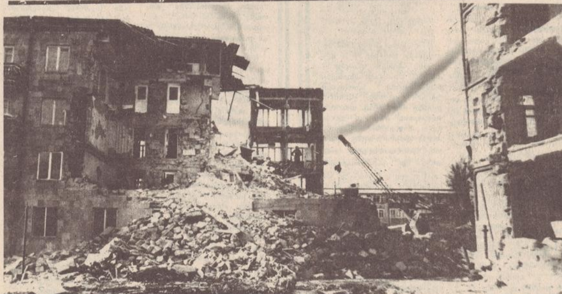
Կոշտյան փողոցի բնակիչները աղետից ձեռք: