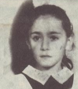
ԳԱՆՆԱՆ ԻՆՑՈՒԻ ՄԱՐԳԱՐՅԱՆ

Լուսինե ծնվել է 1980 թ. Ապրիլում էր № 4 դպրոցի 2-