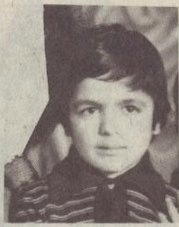
ԱՐԵՎԼԱՏ ԱՄԱՍԻ ԹԱՎՈՒՑԱՆԸ ՃՈՎԷԼ Է 1981 թվ., սովորում էր Ծիրագի անվան դպրոցի 2-րդ դասարանում: Փոքրիկ էր, բայց հրաշալի ձայն ուներ: Հիացմունք էր պատճառում ոչ միայն երգելով, այլև ազդեցիկ ամուսնուհի: Արևհատն էլ երազում էր դերասանուհի դառնալ, բայց քրոջ և եղբոր նման անկատար մնացին նրա երազանքները: Միանգամից թոշնեցին այս տան երեք ծաղիկները:

Մննվել է 1973 թ., սովորում էր Գ. Գուրյանի անվան № 28 միջն. դպրոցի 9-րդ դասարանում: Հետաքրքրությունների լայն շրջանակ ուներ, մասնակցում էր պիտաներների պալատի գործունի խմբակի պարապմունքներին, լավ էր երգում: Երազում էր երգչուհի դասնալ, բեմ բարձրանալ: Բնավորությամբ խելոք էր, համեստ,