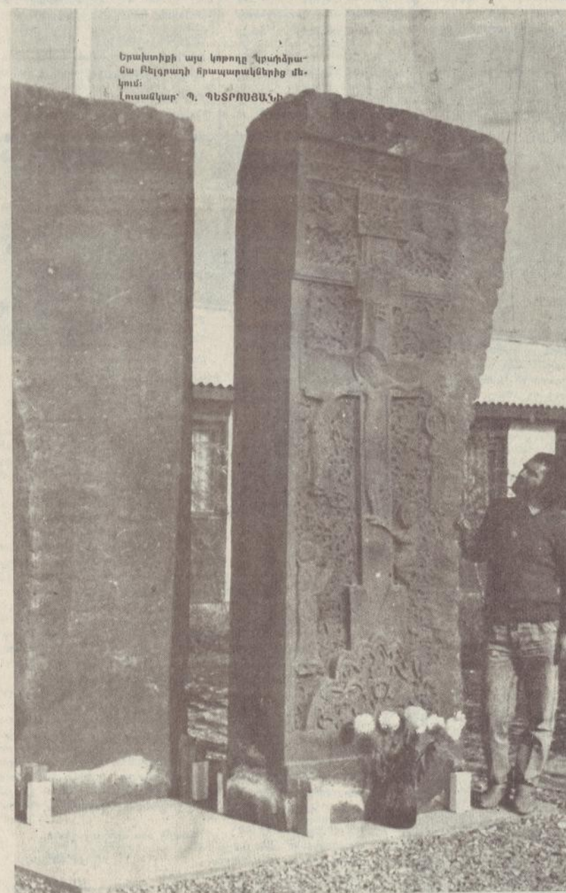
Երախտիքի այս կորոզը կրամորա-նա Բեյզրադի հրապարակներից մե-կում: