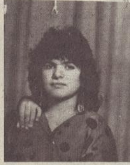
ԱՐԵՎԼԱՏ ԱՄԱՍԻ ԹԱՎՈՒՑԱՆԸ ՃՈՎԷԼ Է 1981 թվ., սովորում էր Ծիրագի անվան դպրոցի 2-րդ դասարանում: Փոքրիկ էր, բայց հրաշալի ձայն ուներ: Հիացմունք էր պատճառում ոչ միայն երգելով, այլև ազդեցիկ ամուսնուհի: Արևհատն էլ երազում էր դերասանուհի դառնալ, բայց քրոջ և եղբոր նման անկատար մնացին նրա երազանքները: Միանգամից թոշնեցին այս տան երեք ծաղիկները: