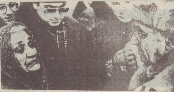
Շաղ Ազնավորն ազի է կկի իր նախնայ ազնուկվամ եզերին