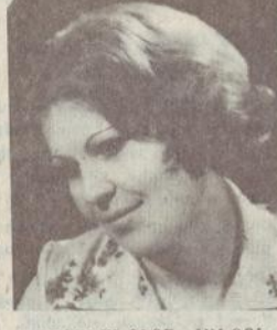
ՍԱՀԱԿԱՆՈՒՅԵ ՀԱԿՈՐԻ ՀԱՄԱՍՋՅԱՆ

Մնվել էր 1953 թ. մարտի 26-ին: Աշխատում էր բաղխորհրդի գյուղ-բաժնում որպես հրահանգիչ: Ուներ երեք երեխա: 1988-ի աճավոր երկրաշարժի ժամանակ նա գտնվում էր Կալինինի փողոցի իր բնակարանում, որտեղ էլ իր մահկանացուն կնքեց փլատակների տակ: Սահականույշը համեստ կին էր, բնտանիքի լավ մայր: