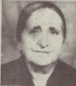
ՊԱՏՄՈՒՄ Է ԱՂՋԻԿ

ՀԵՂՈՒԾ ՄԿՐՏԻ ԹՈՓ. 28ԱՆԸ ծնվել է 1910 թ. Դարսում: Դատն է անցել Թոփ չլանի մանկությունը. 8 տարեկան է եղել 1918-ին, փախել են Դարսից: Մայրս շատերի հետ անցել է գաղթի