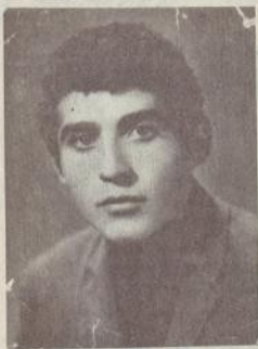
Չրացավ 36 տարին, դարձավ արհավիրքի անմեղ զոհ:

Դեռ դպրոցական տարիքում սիրում է հետաքրքրվում էր գիտությամբ, ձգտում ուսում ձեռք բերել: Ավարտեց Լեհի-նականի թեթև արդյունաբե-րական տեխնիկումի մեխանի կական բաժինը: Գերմանիա-յում մտապելուց հետո վերա-դարձավ հայրենի քաղաք և աշխատանքի մտավ Ախուրյա-նի ջրային տնտեսությունում որպես ատոլձագործ: Տներ էին կառուցում կարիքավոր-ների համար, երբ սկսվեց ա-նիրավ ցեղամուր: Ուզեց հաս-