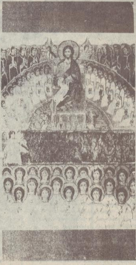
Բարի՛ գարուն, բարի գարուն, բարի գարուն

Ելան մարդիկ՝ հագար-հագար, Ելան հասան Հայոց աշխարհ Եվ ինչ անասն՝ ա՛յլ էլի հրաշք, Ինչ երկաշարժ, Խեղեղ երկին, երկին կերի, Խեղեղ էր մարի միտանի, Էնդ կոզան փող ծախ կանեւ, Էնդ կոզան փող բոց կանեւ, Մեղի էր մի խառնայ պատանի, Ո՞ր եկել էր, բարձրանալու Մարտապետ Այլ կանգալու... Թե ե՛, ե՛, ե՛, ե՛, լավ իմացել, Հայաստան շահարգել է՞ր Խորակի վրա ջգվամ, Կուր ես շահարհարել... Բարի գարուն անեմ եւս, Բարի գարուն խառնայ բոլին, Էն անավեր, Էն բնավեր անհայտ բային՝ Բարի՛ գարուն... Ինչ վանի ավիաների մէջ բռնվամ, Բարձրանալու կանգնեմ մեզում, Հանեա՛ր մանչիկ՝ բարի դարամ, Մատաղ եւս՝ հայոց բարին, հայոց օտարին... Աստվածածին՝ Էն ինքուրի Բարի՛ գարուն, բարի գարուն, բարի գարուն