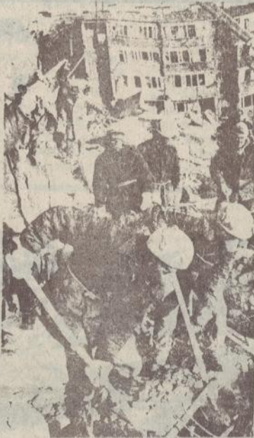
Մեր օտար հարազատները