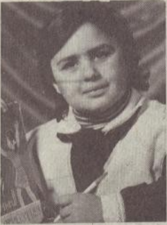
ԱՎԱՐԻ ԱՄԱՍԻ ԹԱՎՈՒՑԱՆ

Մննվել է 1973 թ., սովորում էր Գ. Գուրյանի անվան № 28 միջն. դպրոցի 9-րդ դասարանում: Հետաքրքրությունների լայն շրջանակ ուներ, մասնակցում էր պիտաներների պալատի գործունի խմբակի պարապմունքներին, լավ էր երգում: Երազում էր երգչուհի դասնալ, բեմ բարձրանալ: Բնավորությամբ խելոք էր, համեստ,