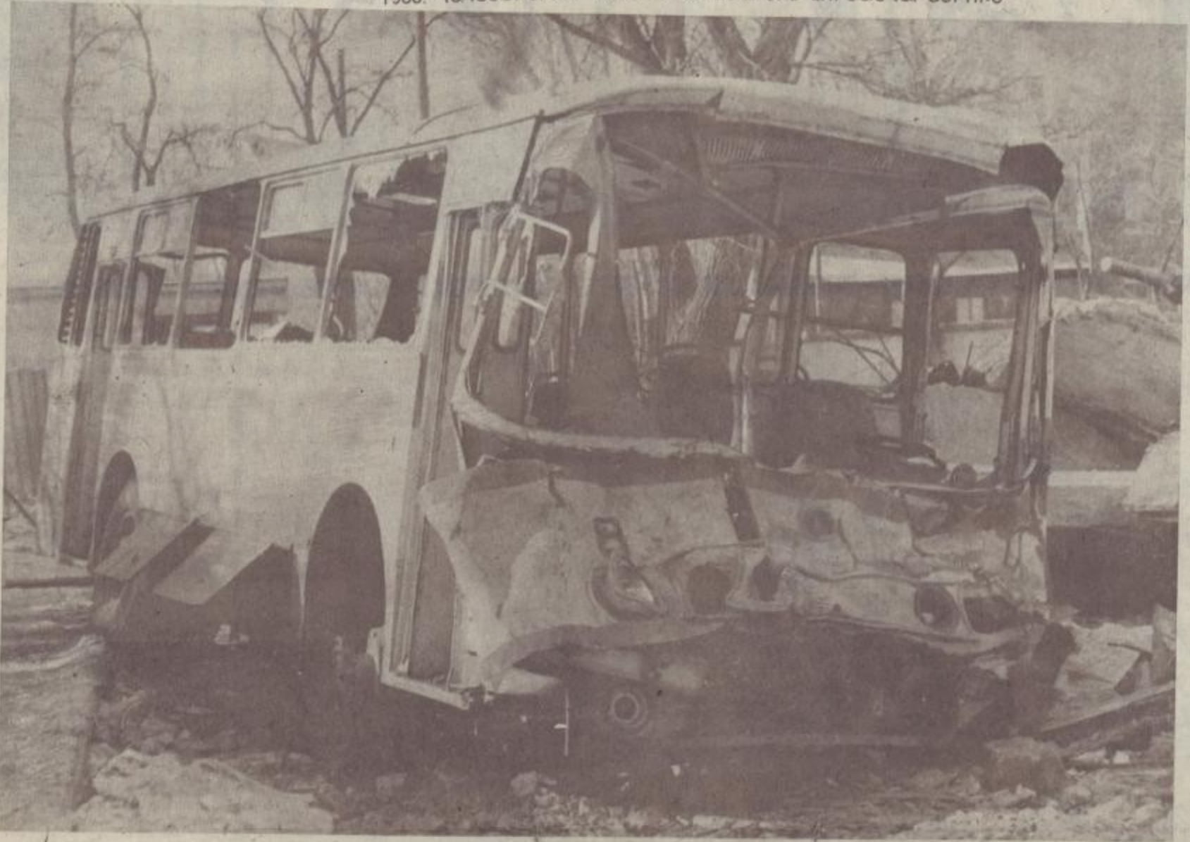
1988. ՂԵԿՏԵՐԵՐԻ 7 ԱՐՆԱԿԻՐԻ ՀԵՏԵՐԸ ԼՈՒՍԱՆԿԱՐՆԵՐՈՒՄ