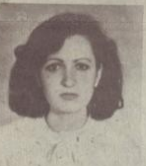
Մեկում թիշկները յոթ օր պայքարում էին նրա կյանքի համար, բայց մահը գործը գտնվեց:

Դեկտեմբերի 7-ին տուն էր կել նախաճաշելու թոռնիկի ու հարսի հետ ու... Երեքով զոհ դարձան անավոր աղետին: Փլատակների տակ մեկ օր ու կես իր շնչով տաքացրել էր խեղդված թոռանը: Վերջին բառերը, որ լսել էր որդին Երանից այս էին՝ «Չկարողացա փրկել ընտանիքը, տղա ջան»: Երևանի հիվանդանոցներից