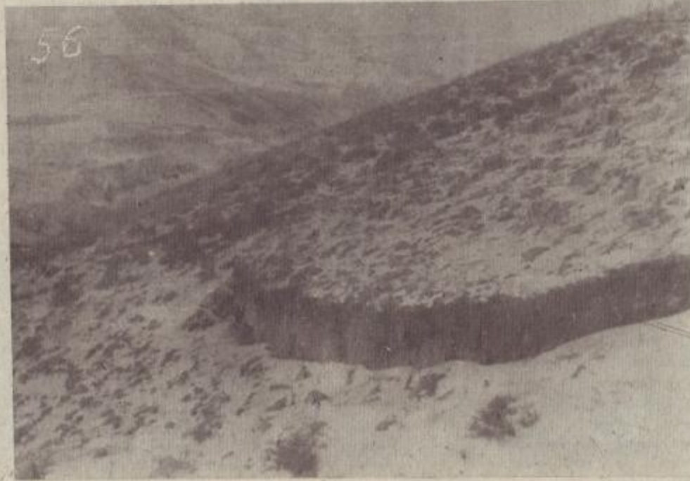
Նկար N 55 և 56—1988 թ. դեկտեմբերի 7-ի երկրաշարժի ժամանակ առաջացած խզումը, որը ձգվում է Գեղասար գյուղից մինչև Սպիտակ: