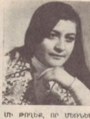
ՄԻ ԹՈՂԵՔ, ՈՐ ՄԵՌՆԵՄ ՎԵՐՅԻՆ ԲԱՆԵՐԸ մնացին օդում, մնացին նրան փրկությունների հիշողություններում: Կանչում էր ամուսնում, մյուսներին, խնդրում շուտ օգնեն իրեն, հասնեն...