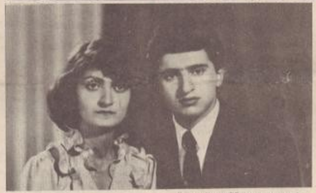
ԸՆԴՈՒՆԵՐ 22 տարի ապրեց ԳԱՅՆՆԵ ԱՐԵՐՏԻ ՆԱԶԱԹ ՅԱՆԸ: