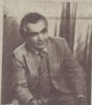
ԳԱՐՈՒՎ ՀԱՐՈՒԹՅՈՒՆԻ ՎԱՐՊԱՆՏԱՆ

ԷԱԱ և ԱՐՄԵՆ ԿԱՐԱԳԵՏՏԱՆՆԵՐԻ անունները չգրվեցին դպրոցական մատաններում, որին պահպան անհամբերությամբ էր սպասում Ջենման, գրվեցին սառը, գրամիտ բարբի վրա: «Հիմա ինչպես կսիրեմքի մայրական իմ սիրտը,—շարունակում է մայրը,— ինչպես կհաշտվեմ չարամ գարունների ցավի հետ: Ապրում են շիրիմները գորգորկու հագում են պահ տալ ցավը մի մոր, որի գեղեցկատես դուստրը Ջենման, չհասցրեց թուրել երեսունը: Առավ իր չորս ու 5 տարեկան մանկիկներին և հեռացավ՝ հավերժի ճամփանով: Ժենյա մայրիկը այդ օրը գնալու էր նրանց տեսության, սակայն տիրոջ կամոք մա մնաց, որ հետո գրկի նրանց ցուրտ շիրիմները... Մեծաց, իսկ ակամքներում դեռ Ջենմայի կանչող ձայնն է: «Դու գիտես, աղջիկս, ես ե-