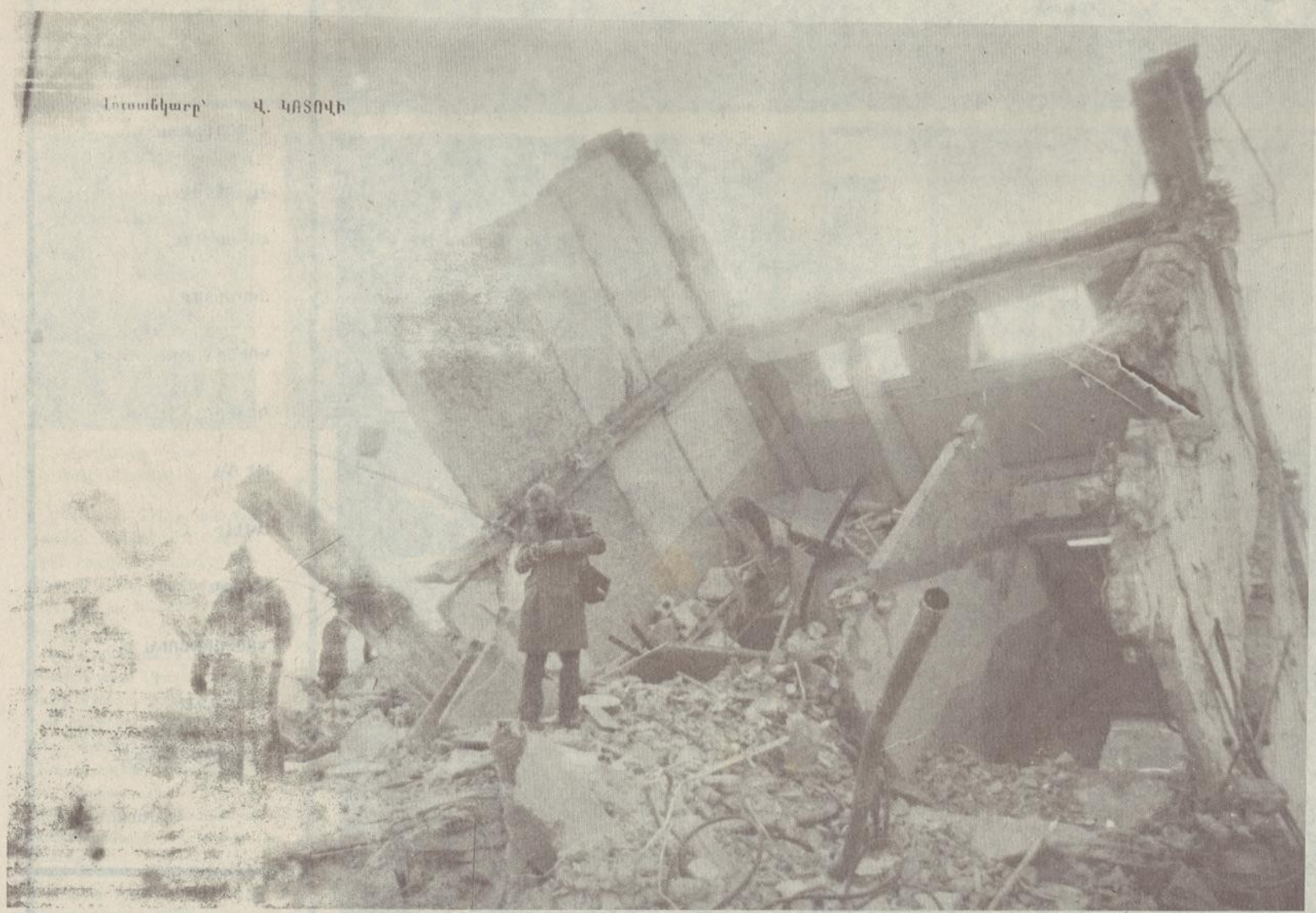
Խոտանկարք՝ Վ. ԿՐՏՈՎԻ