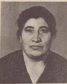
ՎԱՀԱՐՅԱՆ ԱԶԳՈ ԱՂԱՍՈՒ