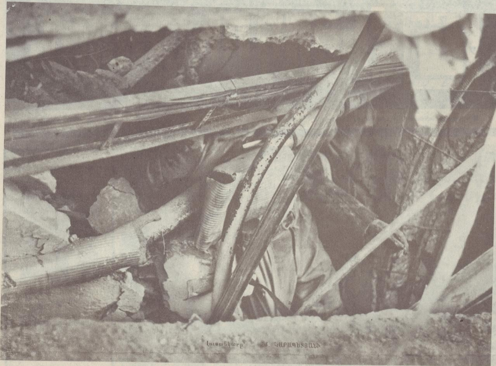
Խոտանկարք Վ. ԿՐԱՊԵՏՅԱՆԻ