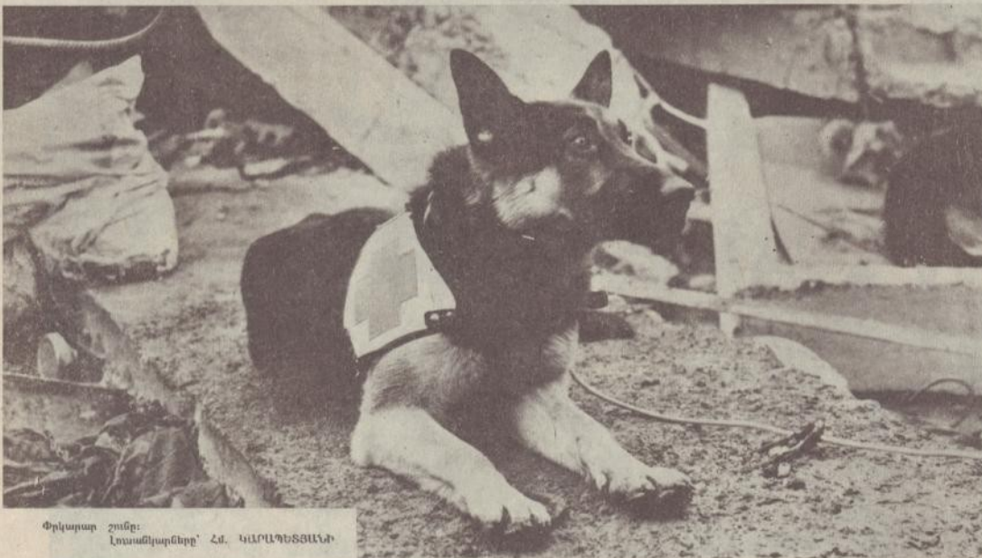
Փրկարար շունը: