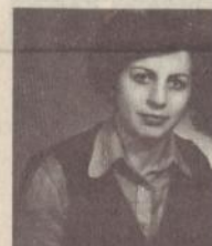
Աղետի ամենը գրեթե մեկը էլ նա եղավ: 40 տարեկան էր, կարի ֆարիկայի աշխատակցին, ի կենսասիրտ:

Խոյ: Սակայն երջանկությունը կարճատև եղավ, հետևեց ճակատագրի ծանր հարվածը: Վերստին աղջիկը հիվանդացավ: Անուստույ մահից հետո ամբողջ տան հուճ մնաց թու: Չորս տարի լուրջաբան իմանալից զավակի: Սակայն շարադույց արձեղ թույլ չետվեց, որ տեսնեի կյանքի 41-րդ գարունը: Երեք ցանկ կյանքին: չճանալով թե երբ երևիամերին, որոքը արդեն գրկված էին հորից: ԳԱԳՈՒԻ ԲՅՈՒՂԳՈՅԱՆ ՅԱՆՆԵՐ: