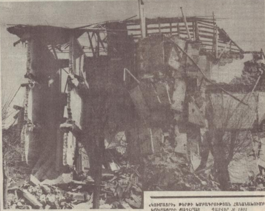
«ԿՈՒՄՍԱՐԻ ԹԵՐԻ ԿՄԱԿՐՈՒԹՅԱՆ ՀԱՆՁՆԱՆՈՒՄ ՎԴԱՅՈՒՄԻ ՔԱՂՎԱՅ ՊԱՏՎՈՐ N 1801