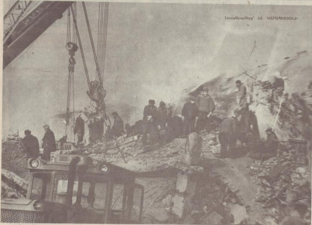
Լուսակարմիրը՝ Հճ. ԿԱՌԱՊԵՏՈՒԹՅԱՆ