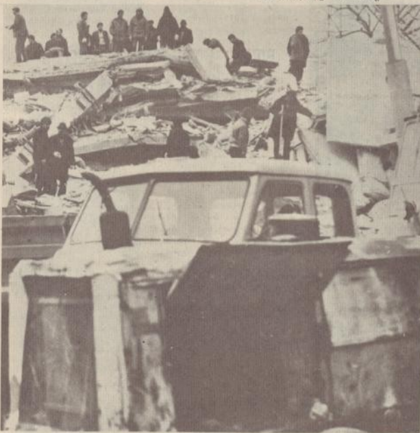
Փրկարարական աշխատանքներ տեքստիլ բանավանի մնարկանի շենքերի վրա: