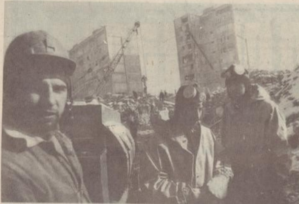
Շիրակացի փողոց. 20/XI-89 թ.