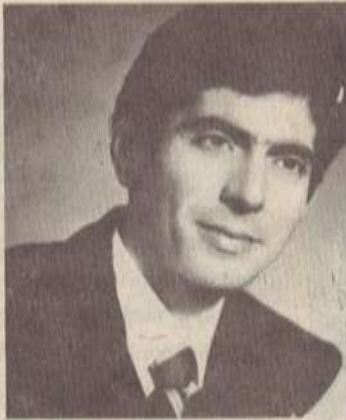
ՀԱՅՐ ԵՎ ՈՐԴԻ