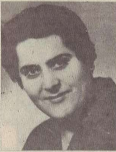
այնս չվերադարձար: Հեռացար և ընդմիշտ արցունքով լցրիր քո Յ դուստրերի աչքերը: Մնացինք քո տունդարձի /անապարհին:

Այդպես էլ եղավ, թանկագին ծնող, սիրելի իմ մայր: Դեկտեմբերի 7-ի առավոտյան գնացիր աշխատանքի ու