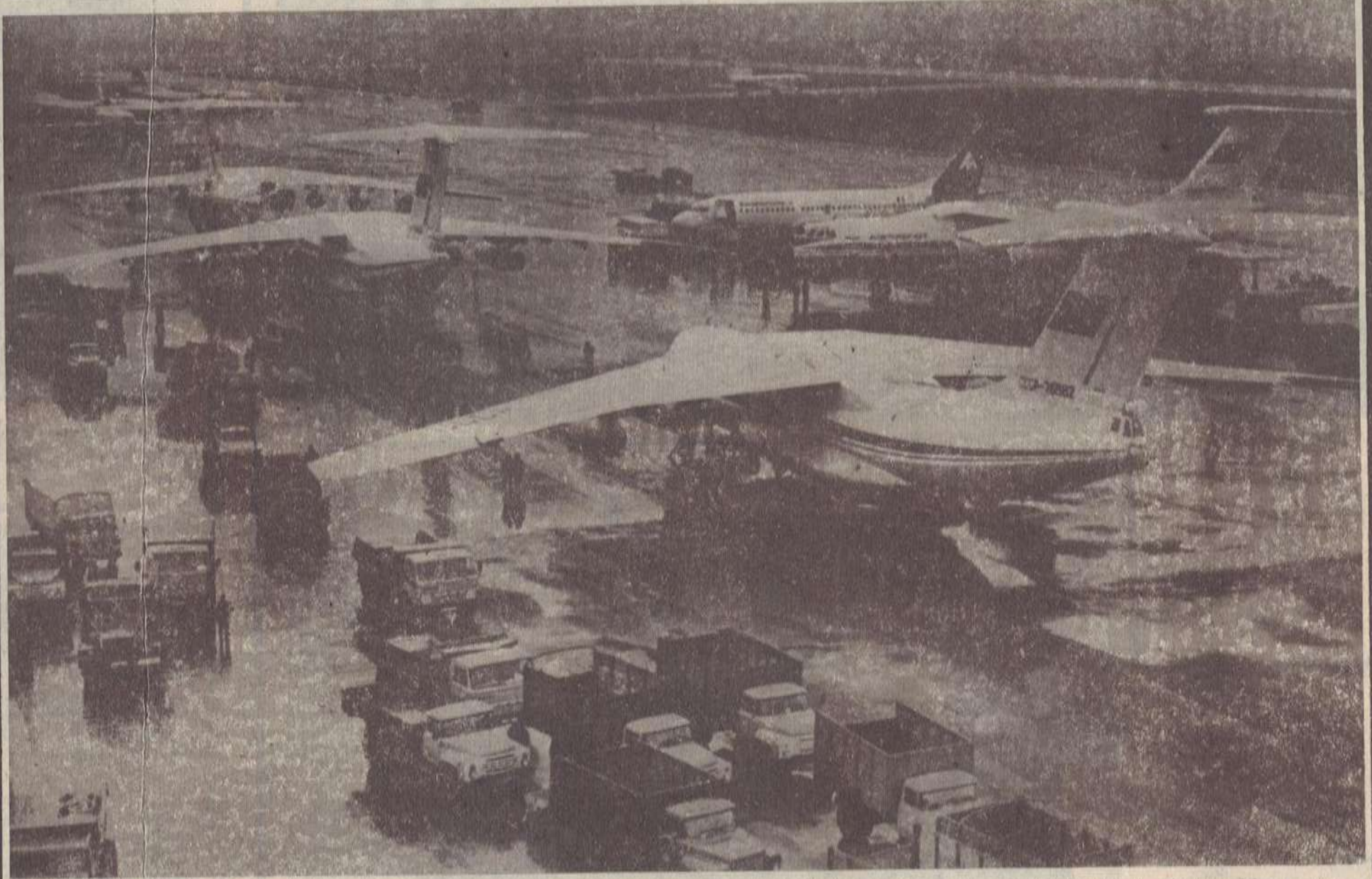
Երևանի «Ջվարթնոց» օդանավակայանը դեկտեմբերյան ավն ողբերգական օրերին դարձել էր համայն աշխարհի գթասրտության կենտրոն:

Այլևս Ակարագրություններ պետք չեն, պետք չեն իտքեր... Մենք, որ հագարավոր, տասնյակ հագարավոր դոնորների արյունով նույնամուտ ենք, նույնամուտ ենք տեսնում ու գգում, տխրում, լախ ու նաև՝ տոկում: Համագային պս աղետի ժամին բոլոր ող- (Չարունակությունը՝ 2-րդ էջում)