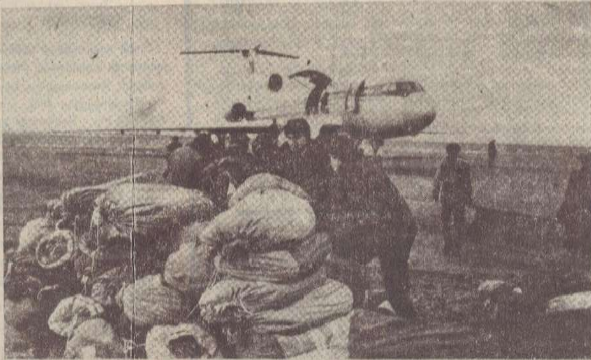
Անհնական: Օդանավակայանը դեկտեմբերի 8-ին: Ոգնության առաջին ինժեները: