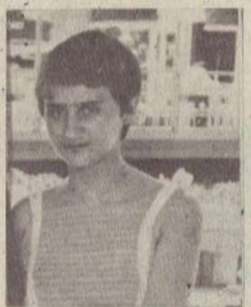
ԵՆԳՈՑԱՆ ՀԱՄՄԻԿ ՍԵՐՑՈՒԹՅԱՆ

Տիեզերքի լուսատուները քեզ էլ այս կյանքում միայն 14 գաղտնի տվեց ասրելու համար: Աճ 20 դպրոցում ընդմիշտ մը մացածներից մեկն էլ դու էիր: Ծնող՝ իր սիրելի էիր, ներանց հույսը, ուրախությունը: Զարմանքն էր ստույգ քո սիրունիկ դեմքին, նաև հարց... «Այս ի՞նչ պատահեց». Եվ ոչ ոք քեզ չպատասխանեց: Հայաստան-քարտուտան աշխարհի քարտերն էլ քո և դասընկերներից շատերի, հազարավոր հայերի ողբերգական վախճանի պատճառը դարձան: Նմջիր խաղաղ, քո հիշատակը քո ծնողների, քո հարազատների, քեզ ճանաչողների սրտերում կլինի հավետ: