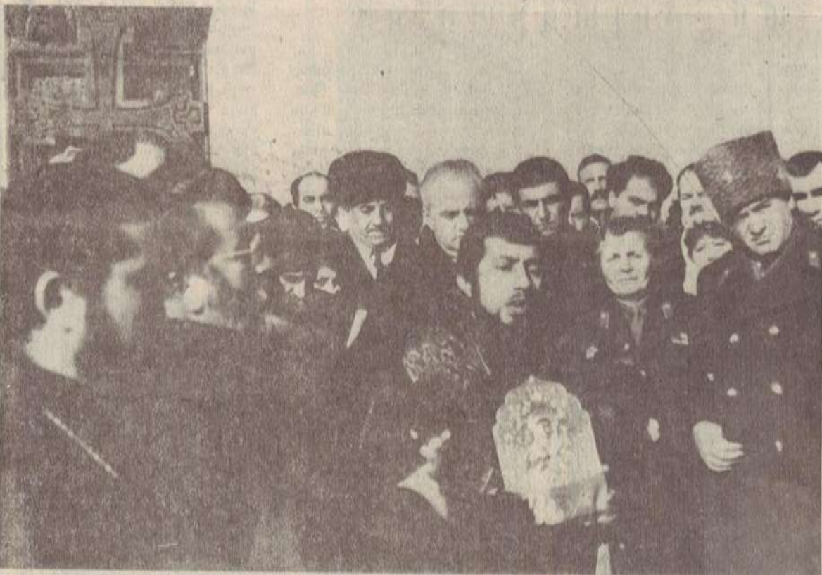
Օիրակի գերեզմանատանը խաչքարի բացման արարողության ժամանակ:

Նմջեցեք խաղաղ, անմեղ զոհեր, և Աստված պահապան Ձեր հոգիներին: