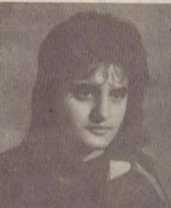
ԱՆԱՀԻՏ ՌՈՒՄԵՐՏԻ ԹՈՒՄԱՆՅԱՆ