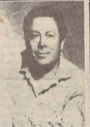
ՍԻՍՅԱ ՔԵ ՄԱՅՐՈՍ... ՈՆՋՄԻԿ ՆԱՊՈՒԵՆՈՒՍԻ ԲԱՂՂԱՍՍԱՐՅԱՆԸ