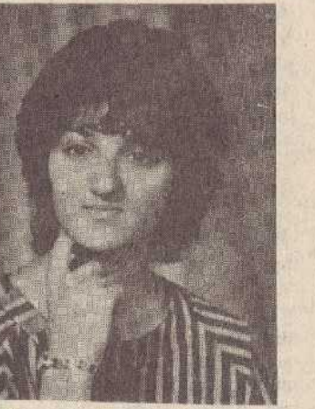
Նոր էր լրացել 17 տարին, Արի մեզ կյանք տուր, խնդրում եմ, արի:

Հազիվ 17 գարուն տեսած աղջնակը թողեց ծնողներին խոր կսկիծի մեջ: Եվ որդեկորույս հայրը փորձում է բանաստեղծության լեզվով խոսել դստեր հետ. Իմ ընթաց ծաղիկ, անգին մարգարիտ,