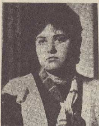
Լուսինեն, չհասցրեց մատնա հարել նրա պատուհանը:

Նոր գարունը՝ 1989-ի գարունը, չհասցրեց այցի գալ