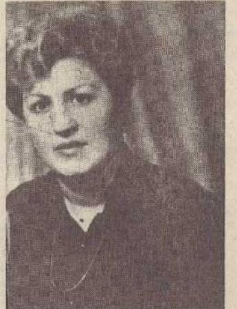
Քի, մարդկայնության ու քարի տրամադրություններ:

Խանումը սիրում էր ամենինչի գեղեցիկն ու կատարյալը: Եվ ամենուր՝ հրավերքն էր, խնջույքներ, ցանկալի հանդիպումների ժամանակ նրա ներկայությունը նկատելի էր, հետաքրքիր: Նա ողջ հը մայր էր իր գեղեցիկ ձայնով, ազգագրական հաշտեմաշունչ երգերի գեղեցիկ կատարումներով, որ շրջապատողների մեջ արթնացնում էր հարգանք: