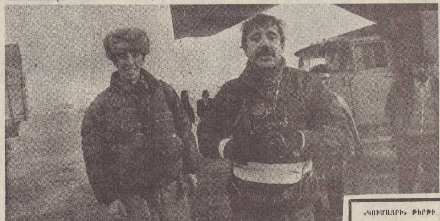
Ճրանկիացի լուսանկարչա կան թղթակիցները և նիմականում:

«ԿՈՒՄԱՏՐԻ» ԹԵՐԹԻ ԽՄԲԱԳՐՈՒԹՅԱՆ ՀԱՆՁՆԱԽՈՒՄԻ ՎՊԻՍԱՅՐԻԻ ՔԱՂՀՐԱՏԻ ՏՊԱՐԱՆ, ՄԱՅԻՍՅԱՆ Փ. 47