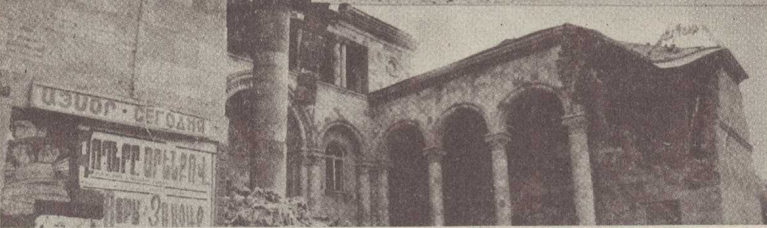
Այսպիսի տեսք ունեին Երևանը և Կիրովականը դեկտեմբերյան մտախլուսարտ այն դժնի օրերին: