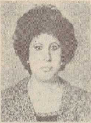
Մ. ՅՈՐՈՑԿԻՅ «ԿԷԻՇԵՄ ԶԵԶ...»

87 հոգի Այսքանը «Մագնոն» հաստիկ կոնսորցիումը... Զիշում են «Մագնոն» ըստ պատմության փակցված մի գործընկերության, որ շեմքի արտադրում էր պատկերված, շատրվաններ, ծառեր: Հեղինակը Անահիտն էր: