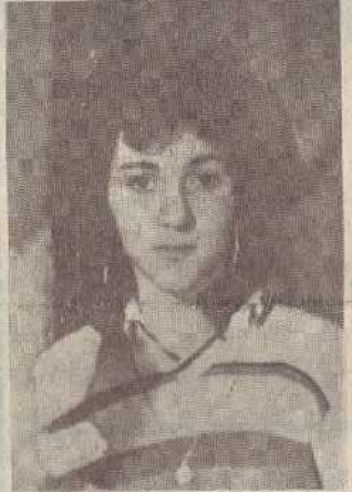
«ԵՆ ԳՏԱ, ՆԱ Է» ՏԻԳՐԱՆՈՒԶԻ ՎՈՂՈՂՅԱՅԻ ՀԱՎՈՐԱԳՆԱԸ ԾՆՎԵԼ Է 1970

1981 թվականին էր ծնվել, հայրը մեծ եղեռնի օրը՝ ապրիլի 24-ին: Ամուսնացել էր, երկու երեխաներ ունեւր՝ մի տղա և մի աղջիկ: Ուրախ ու երջանիկ էր ապրում, մտքով չանցնելով, որ վիճակված չէր երկար ապրելու՝ ամենաուրախ Գյումրին վերաձվելու է ամենատխտր քաղաքի, ողբերգական իր սև կնիքը թողնելով մարդկանց ու սերունդների հիշողության մեջ, իրենով տասնհյակ հազարավոր անմեղ մարդկանց կյանքեր: