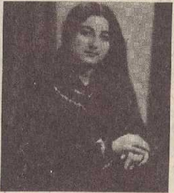
Ու քեզ է ուզում:

Ու քեզ է ուզում: Իսկ դու չես գալիս, Իսկ դու շնիկիս Սպասել ես տալիս: