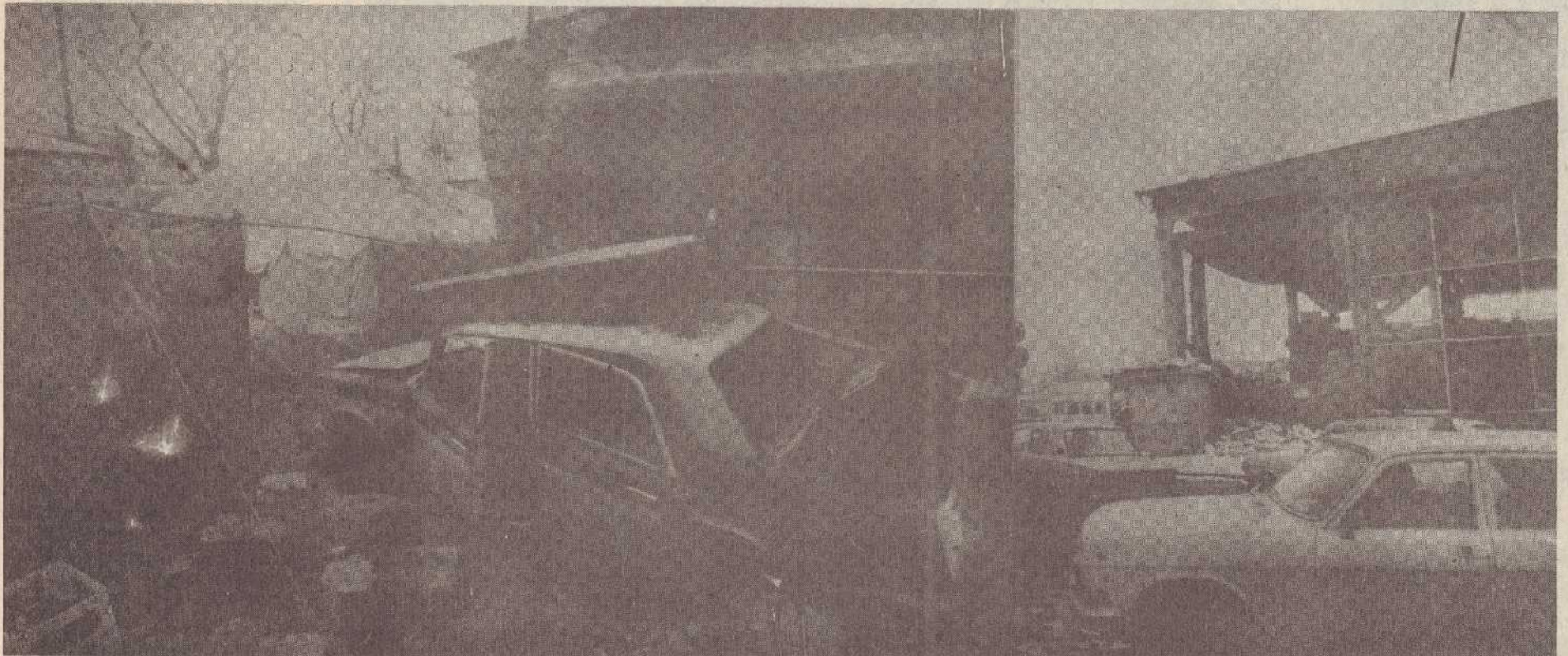
Պատմամշակութային և ավտոկայանի շենքերը աղետից անմիջապես հետո:

(Շարունակելի) «Ապագա» շաբաթաթերթից Կանաղա