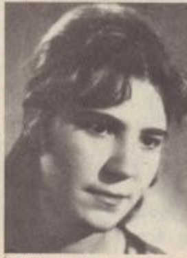
Ծնվել է 1941 թ., պատերազմի ծանր տարիներին, Լեհիստանում: Գերագույն գնա հասականներով ավարտել է