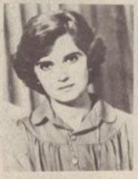
ՄԱՐՏԻՆՅԱՆ ՍԻՂԱ ՎՐՈՒՅՐԻ

Մուշտակը զգած ուսերին բարձրացել է վերև և անզոր է գտնվել 9-րդ հարկից փոխելու: Հինգ օր փլուզող երբ բանդելուց հետո զբոսանք: