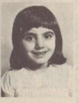
ԵՂԻԿԻՐ ԿԱԳԻՎԻ ՀԱՎՈՐՅԱՆ