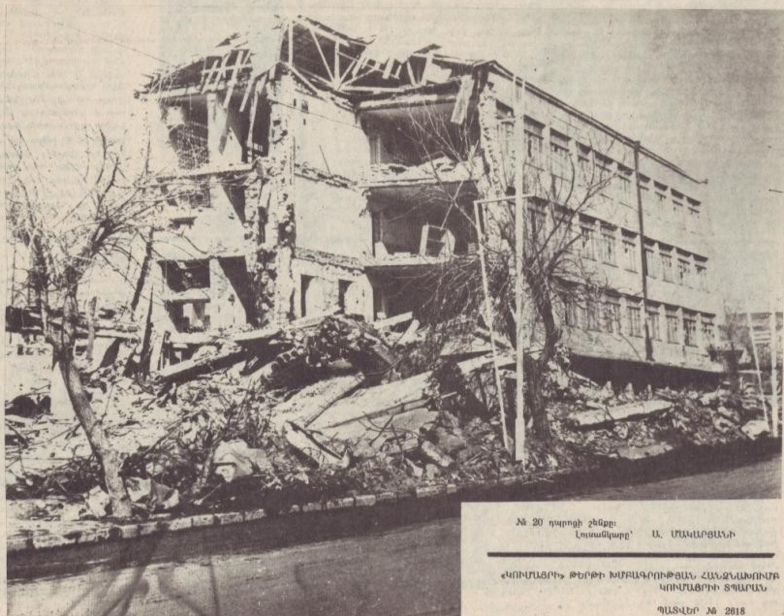
№ 20 դպրոցի շենքը:

Արգանդը վիժեց Հողը պատվեց՝ Աստված ցած փշիք, Անաստված աստված: Ով էր մեղավոր... Ազգս մորթված... Հսում ես, աստված, Անխիղճ արարած: Ես էլ եմ աստված, Այս էր հնարած... Նվ իմ նակատին, Այս դիրն էր գրած: Որդիս, արթնացիր, Անմեղ թնավոր Հայր չի մեռնում, Միրտն է վիրավոր: Արթնացիր և տես՝ Անին նորավոր, Սպասում է քեզ Մուշը զորավոր: Տես այս շենքերին, Գյուճրին վիրավոր, Դու նորից բացվիր Արև Նաիրի: Ժպտա Հովունի Շիրակ աշխարհին, Ժպտա իմ մանուկ Գալիք հույսերի: ՍՈՍ ՄԱՆԱՆԻՅԱՆ Ախալ Բայակ-Հովունի