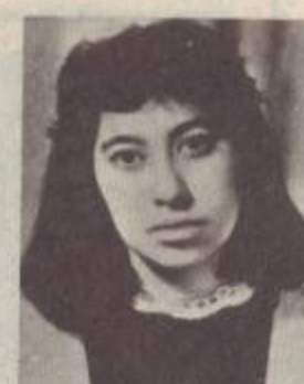
ԱՐՏԵՆ ԳՐԻՇԱՅԻ ՄԱԿՈՒՆՅ

Նճջիր խաղաղ... մայր, քո զավակների սրտում միշտ վառ կմնա քո հիշատակը: