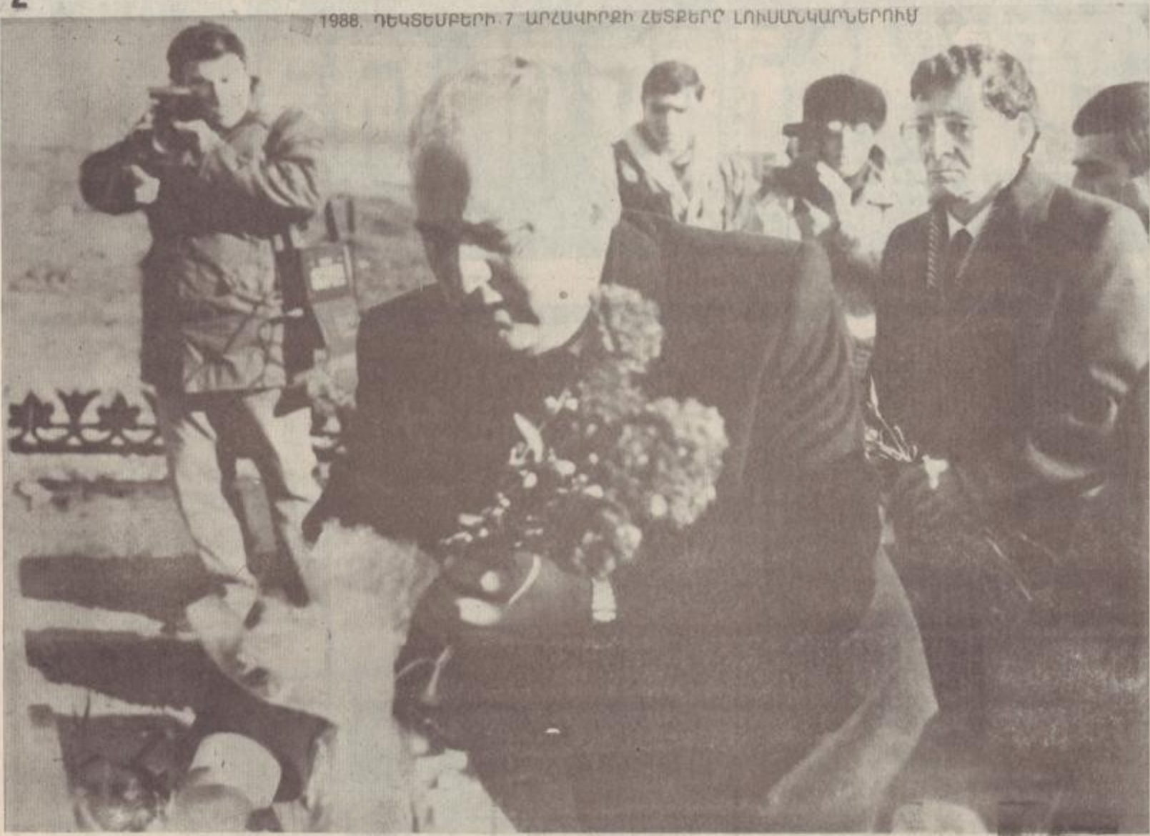
1988. ՊԵՎՏԵՄԲԵՐԻ 7 ԱՐԶԱԿԻՐԻ ՇԵՏԵՐԸ ԼՈՒՍԱՆԿԱՐՆԵՐՈՒՄ