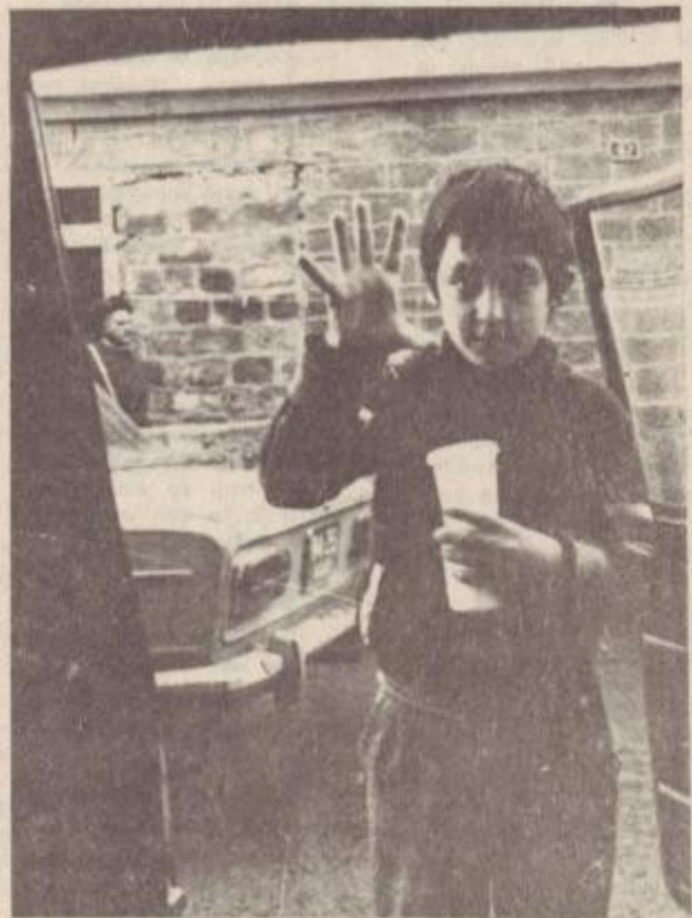
— Բանի՞ց են մնացել դասարանիս... — Հի՞նգը...