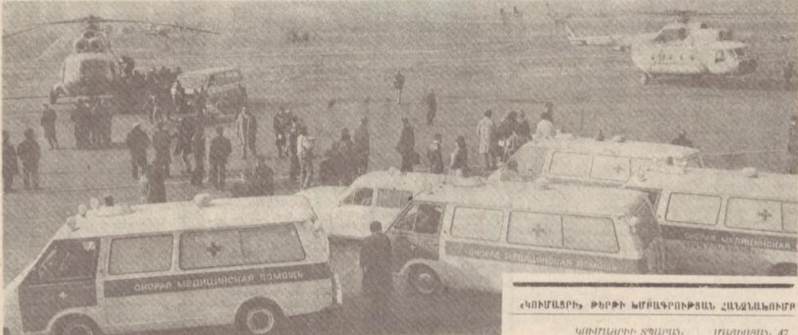
ՎՈՒՄԱՏՐԻ ԹԵՐԹԻ ԿՄՐԱԳՐՈՒԹՅԱՆ ՀԱՆՁՆԱԿՈՒՄ