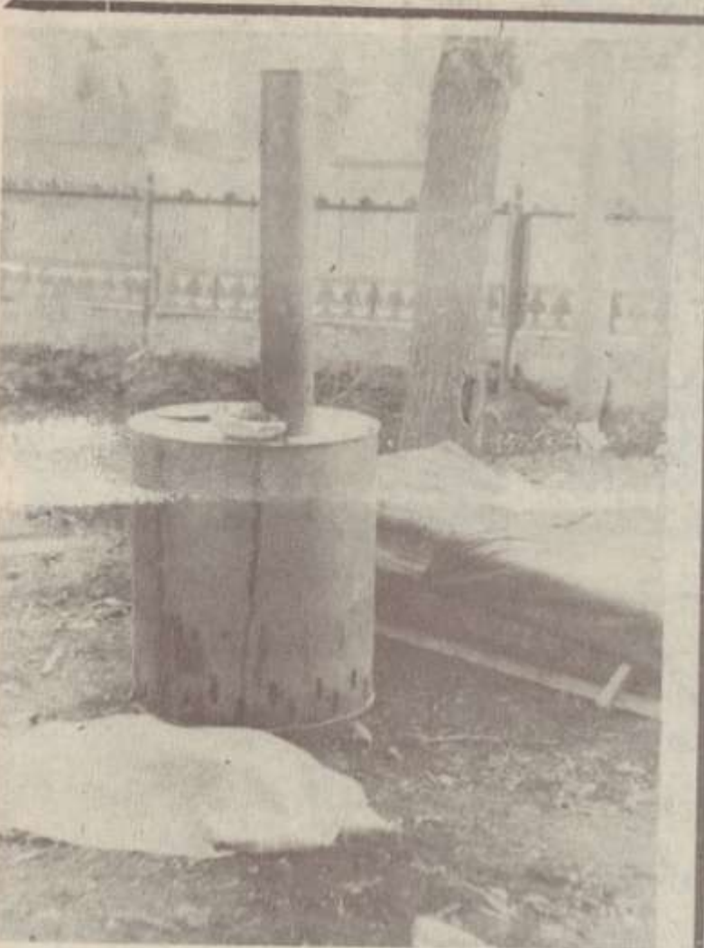
Ժամանակավոր բնակատեղ...