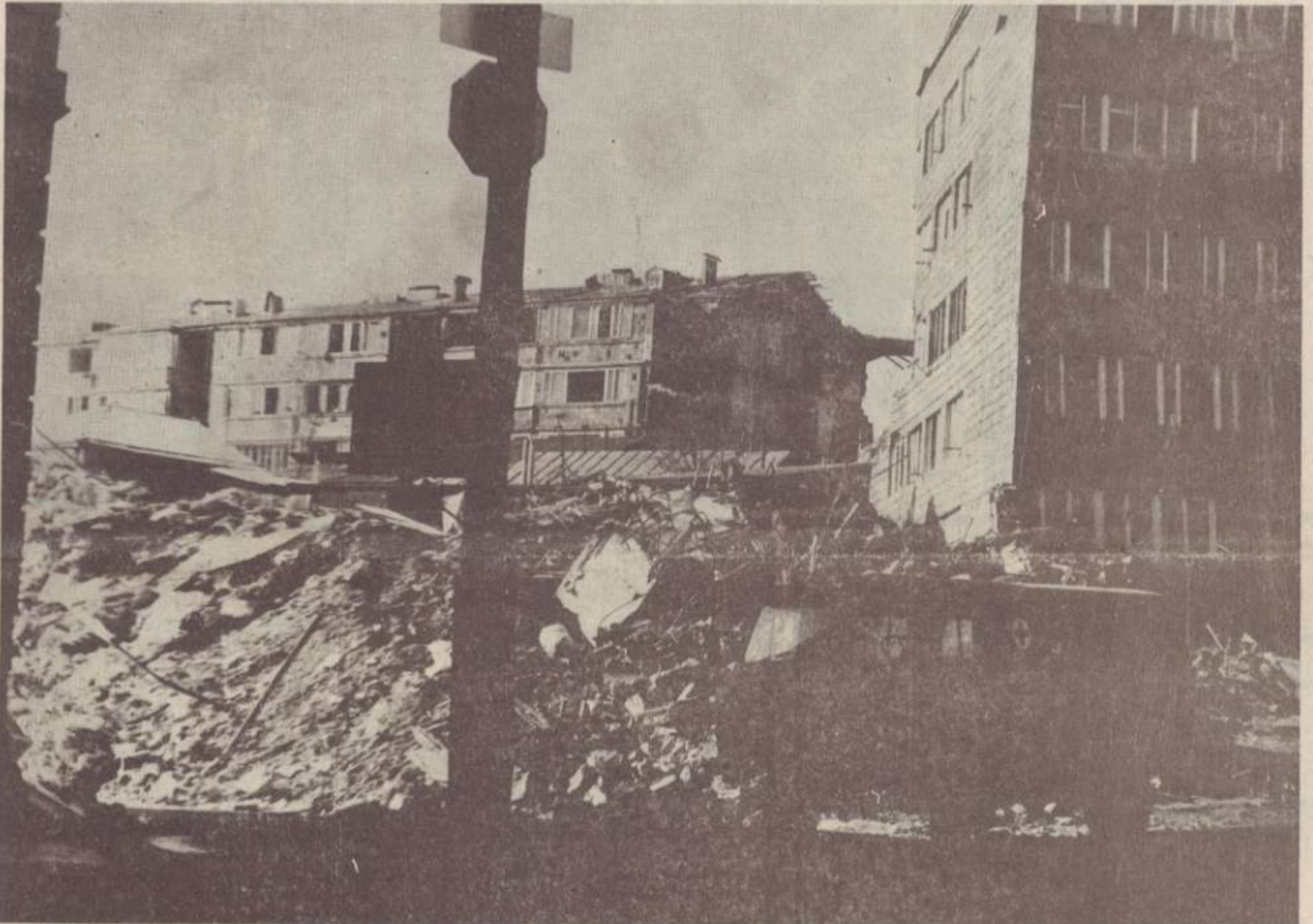
Վայի փողոցը երկրաշարժից հետո: