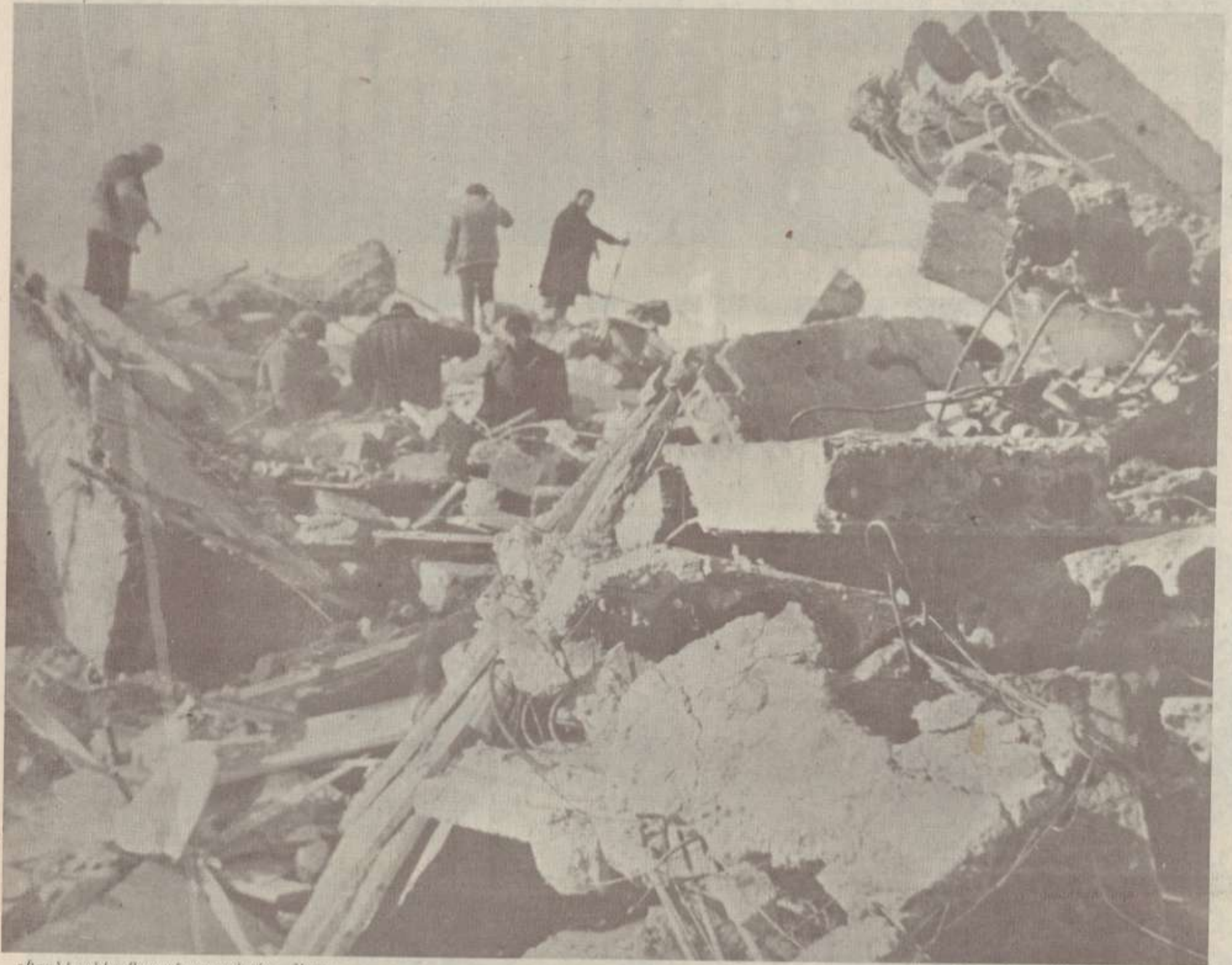
«Սուսանկյունի» թաղամասը արդևտից շեռու: