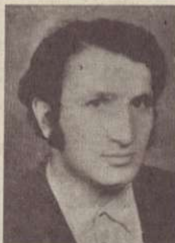
ՀԱՌՈՒՏ ԱՐԶԵՍՏԱՎՈՐՆ ՈՒ ԻՍԿԱԿԱՆ ՄԱՐԻԷ

Չեյ, էնեյ, հեյ, հիջ մանուկի, Չեյ ժողովուրդ աչքես լույս, Իջի ձեկի, հիջ մանուկի, Ինչ մեր ցավը աշտեման Այսպես լինի՝ միշտ ԵՐԿՈՒՄԻ: