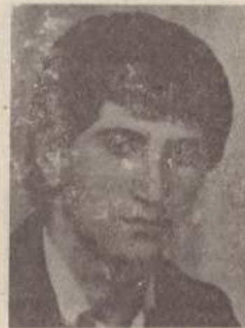
ԻՆՉՊԻՍԻ ՊԱՏԾԱՌ ՏՂԱՆԻՐ ԶԿԱՆ...

ԷՆԷ ՀԱՄԱՐ ՀԱՎԵՐԺ ՄԳԱՃՈՂ ՄԱՅՐԻԿ, ԷՆԷ ԵՐԲԵՔ-ԵՐԲԵՔ ՇՄՈՒՆՃՈՂ ԲՈՒՅՐԻԿ