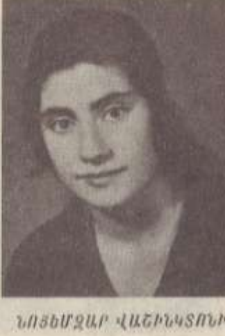
ՆՈՅՆՄԶԱՐ ՎԱՇԻՆԿՏՈՆԻ ՄԱՆՈՒԿՅԱՆ