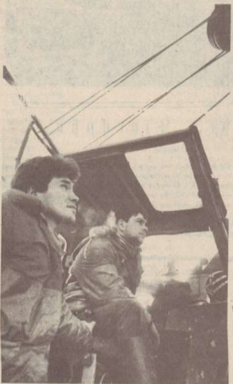
ՆԿԱՐՈՒՄ.— Դերմի մեխանիզատորները Օիրակացի կոնտրոլում պշխատանք կատարելիս: