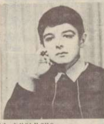
ԵՐԿՐԱՇԱՐԺ, ԹԵ՛՝ ՄԱՂԱՍԲԱՂ