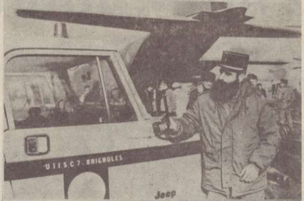
Երևան. «Չվարենց» օդանավակայանը: Դեկտեմբերի 12-ին ժամանած Իրանիացի փեղատները: