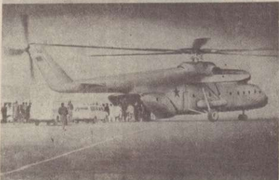
Երևան: Օդանավակայանը: Այստեղ մի Կա-26-ի բազեն մեկ ազնուի վայրերը բաժանարարյան կիև մեկեւում օդանավան և Կազախստանի ԻնՖերիոներն օւ ուղղաթիւները:

Սպիտակ: Ուղղակիական ինՖերիոները առաջին անգամ կիմուրը զգելու: