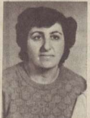
ԱՆԱՀՆՑ ԲԱՂՅԻԳԻ ԻԳԻԹՅԱՆ

Դուրս մեջ կանգնած էր վեցամյա Հովիկը ու մի տեսակ զարմացած, կարտուով նայում էր մարդկանց: Բոլորը շուտ էկան տագնապած, նայեցին երեխային: Ի՞նչ է պատահել: