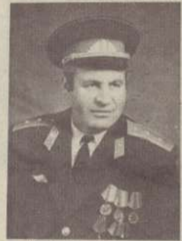
ՊԱՏՄՈՒՄ Է ԿԻՆԸ

Ծնվել է 1988 թվականին Ղուկասյանի շրջանի Թորոս գյուղում: Նա 5 տարեկան էր, երբ