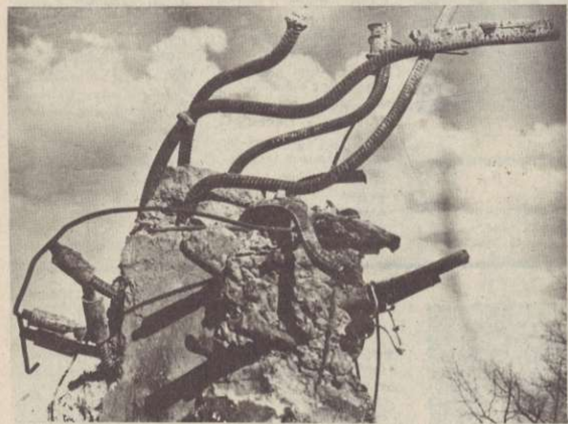
Այս հզոր ամրաններ անգամ չդիմացան...