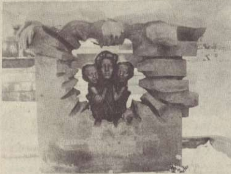
Այս ինքնատիպ քանդակն է ստեղծել ԽՍՀՄ նկարիչնե-րի միության անդամ, Հայաստանի լեհիստան կոմերիտմիությանց դասիներկիր, քանդակագործ Մկրտիչ Մազմանյանը՝ Կարինե, Սերգեյ և Հայկ Մազմանյանների շիրիմին: