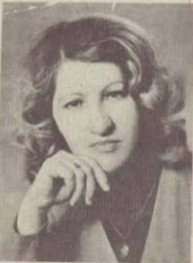
Գեղեցիկ ու տաք ծախտի, առանց նրա կատակների...