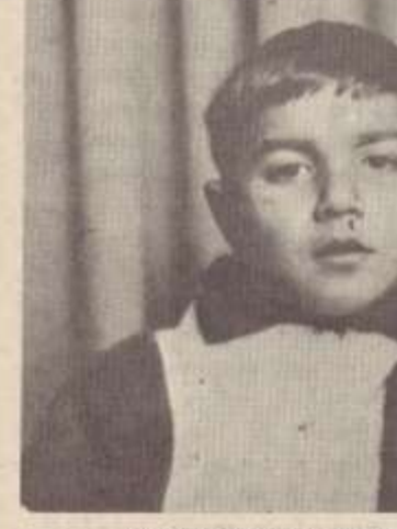
ԵՂՄԱՅՐՆԵՐՆ ՈՒ ԳՈՒՅՐԸ

վան № 10), չկասկածելով անգամ, որ դեկտեմբերյան մի դժնդակ օր կիլվի այն, դառնալով քո մատաղ հոգու վերջին հանգրվանը: Փվոզ դպրոցի պատերի հետ փլվեցին սրտիս դարպասները, փյատակվեցին հույսերս: Ինչքան երազանքներ, ինչպիսի հույսեր ունեիր իմ հոգյակ, և ինչ կույր է բնույթուր, որ իվեց կյանքը քո, և իմ կյանքն էլ դարձրեց անհմաստ ու գորշ: Եվ ինչքան գերում, ինչքան խոսում եմ քո մասին, կենդանանում ես ուկեշող իմ մամուլ՝ հավերժ 18 տարեկան: