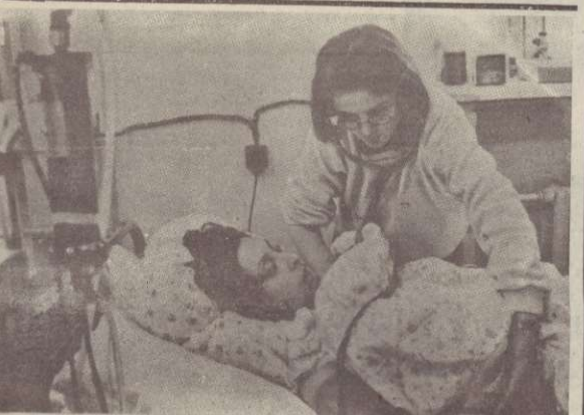
ԽԵՆԱՆ: Վիբարուժության համամիութենական կենտրոնի մասնաճյուղը: Այստեղ են աշխատել ԳՅՀ-ի բժիշկները: