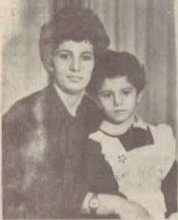
ՊԱՏՄՈՒՄ Է ՀԱՐՍԸ