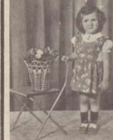
ՊԱՏՄՈՒՄ Է ՄԱՅՐԸ