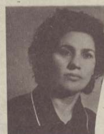
ՍՈՒԿ ԵՎ ՑՈՒԱԿ

սել, երկրաշարժ էր, քարերը թափվում էին երկնքից, սար սափի ճիշով արթնացել և դուրս էր փախել: Քեզ համար էին, որ դա երազ է: Ավազ, երազը իրականացավ՝ կտրելով քո եղբայրիկի և գիտես լույս աշխարհ չեկած մանկիկի կյանքի թելը, ծր նողմերից թողնելով անհուն վշտի մեջ: Իմ փոքրիկ, անուշիկ, ԷԴ-ԳԱՐ, ծնվեցիր ուրախություն պատճառով՝ ծնողներից: Երբ էր լրացել քո մեկ տարին, որ նոր էիր սկսել առաջին քայլերդ, հողը ամուտ էիր գտնում ստրեթիկ տակ: Ավազ, երբ բաց այդ հողը, կտրեց քո մատուց կյանքը, չհասցրեցիր ճանաչել աշխարհը: Այժմ ճանաչում ես անուշիկ մայրիկիդ գրկում, վշտի մեջ թողնելով հարազատներիդ: