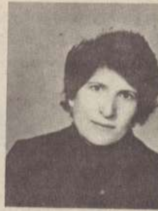
ՊԱՏՄՈՒՄ Է ԲՈՒՅՐԸ