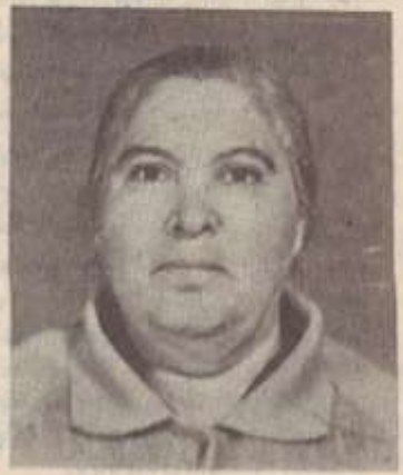
ՄԵԼԻՔՈՆԻ ԾԱՐԻՆ ԷԼԲԱԿԻ

(Սկիզբը՝ 3-րդ էջում) Վայրկյաններ են անցել, Իրենց ազնիվ արյան ժառանգական կանչով Ձի կոչում էին կոչը պապենական... Գարաբաղը մեռ է,— Հիմա էս են կարել ու լուսն են ֆաբրի տակ ու՛ մայրերը հանկուս են ֆաբր... Այդուհետև, լույս ու բանալ խառնվել են իրար, Քարիկ, աչիկ, ծամիկ խառնվել են իրար, Տեղերն արշուճա են, տաներն արշուճա են... Մանուկ երեսուներ, Մանուկ երեսուներ, Ձեր գողգոթան եղավ դարձրոք ձեր... Դու՛ք, որ դեռ լցվում էիք զեղի երազանքով, Դու՛ք, որ զոզանում էիք ազգի ոգու երգով, Դու՛ք, որ սերբ բռնած, Կնույզների բամբին պիտի բռնեիք, Հիմա պառկած եք լուս... Մանուկ երեսուներ, Մանուկ երեսուներ, Կանառակված, Կափաղված ու հեղված, Երկար ու բնուեն ծուռ խաչերով խաչված... Մանուկ երեսուներ, Մանուկ երեսուներ, Ես ձեզ ինչպես ողբամ, Ես ձեզ ինչպես բաղնամ, Ինչպես ինչպես ես ձեզ խաչից... Որ հողը տամ գլխիս, Որ հողը տամ գլխիս, Որտեղի՞ց հող, Երբ էլ հող չմնաց անգամ մի բուռ, Որ մարդ գլխին ցանի,— Հողը գերեզման էր դարձել համատարած Ու շատերին անգամ չհերիքեց... Ախ-սե ֆաբով զարված, Ան չիմաֆաբ դարձած դասարան ու դպրոց, Դպրոց... (Շարունակությունը՝ 7-րդ էջում)