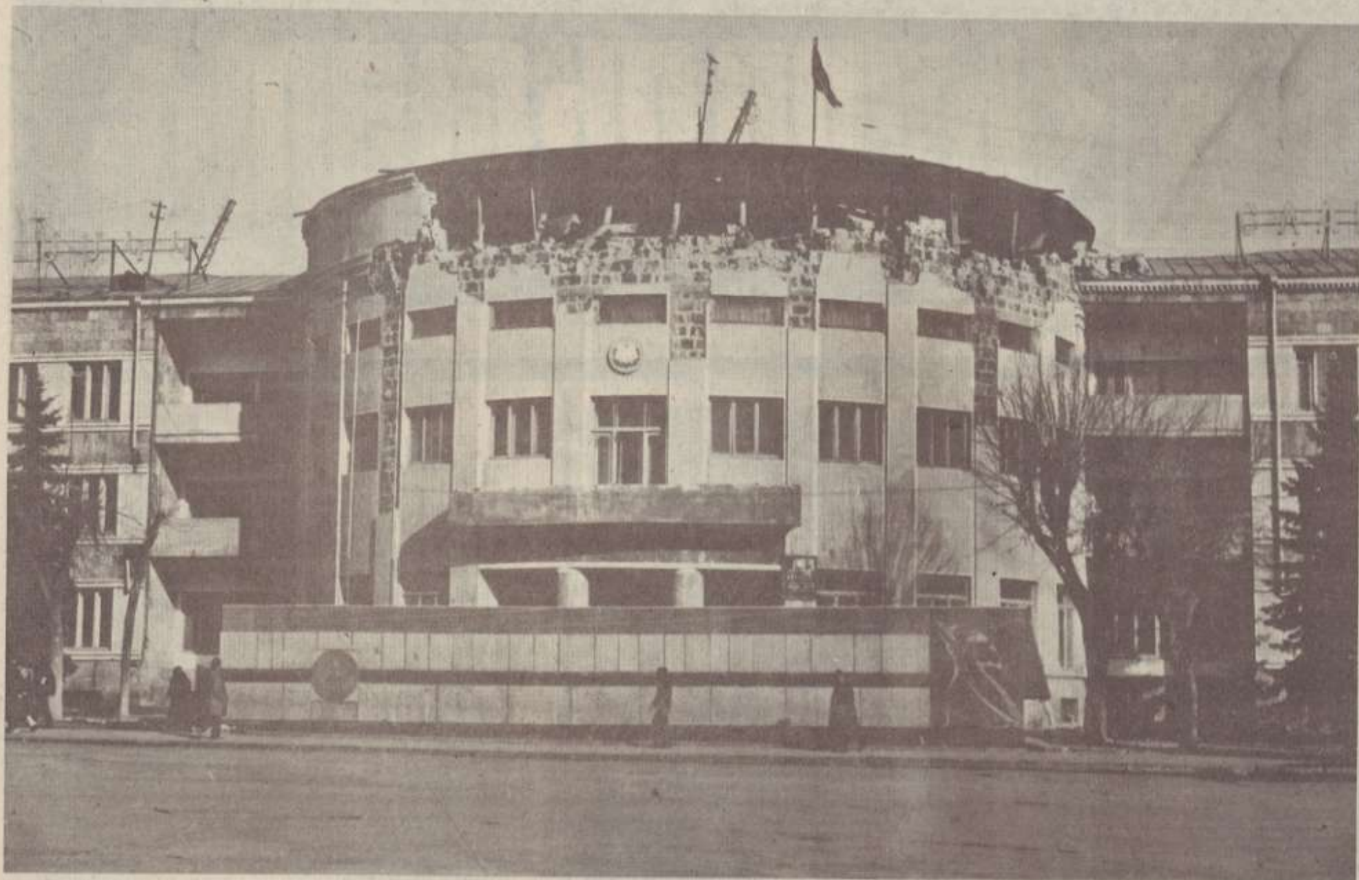
Քաղաքի գործկոմի՝ առաժնային այնքան ամբարձու ու գեղեցիկ շենքը հնարավոր չեղավ փրկել: