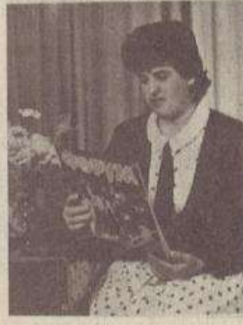
ՄԱՅՐ ԵՎ ՈՐԴԻ