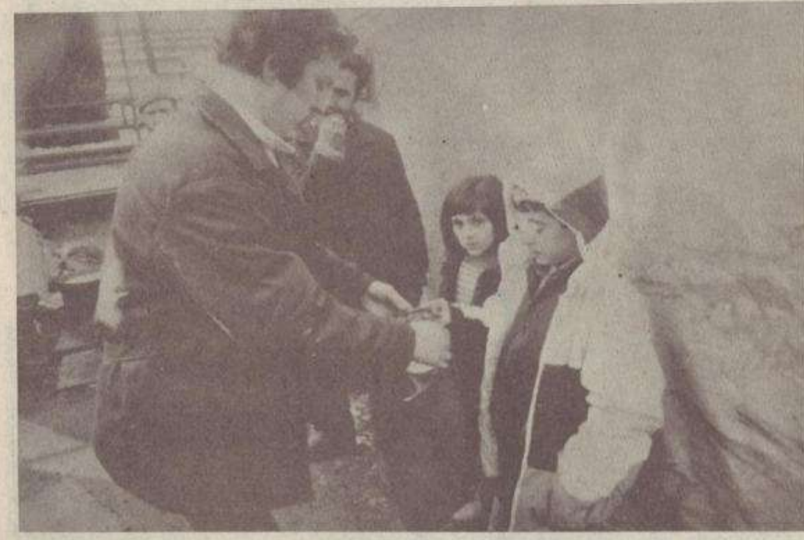
Կոմի ԻՍՍՀ-ի շինարարները գիտեին, որ այստեղ հանդիպելու են նաև կրեյսներին...