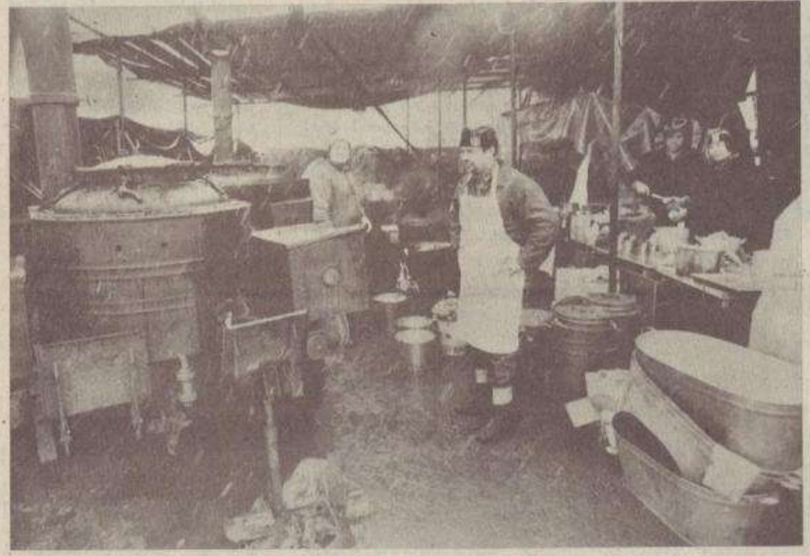
Լեհիմանի մարզադաշտում: Տար ճաշը անհրաժեշտություն էր (18-ը դեկտեմբերի, 1988 թ.):