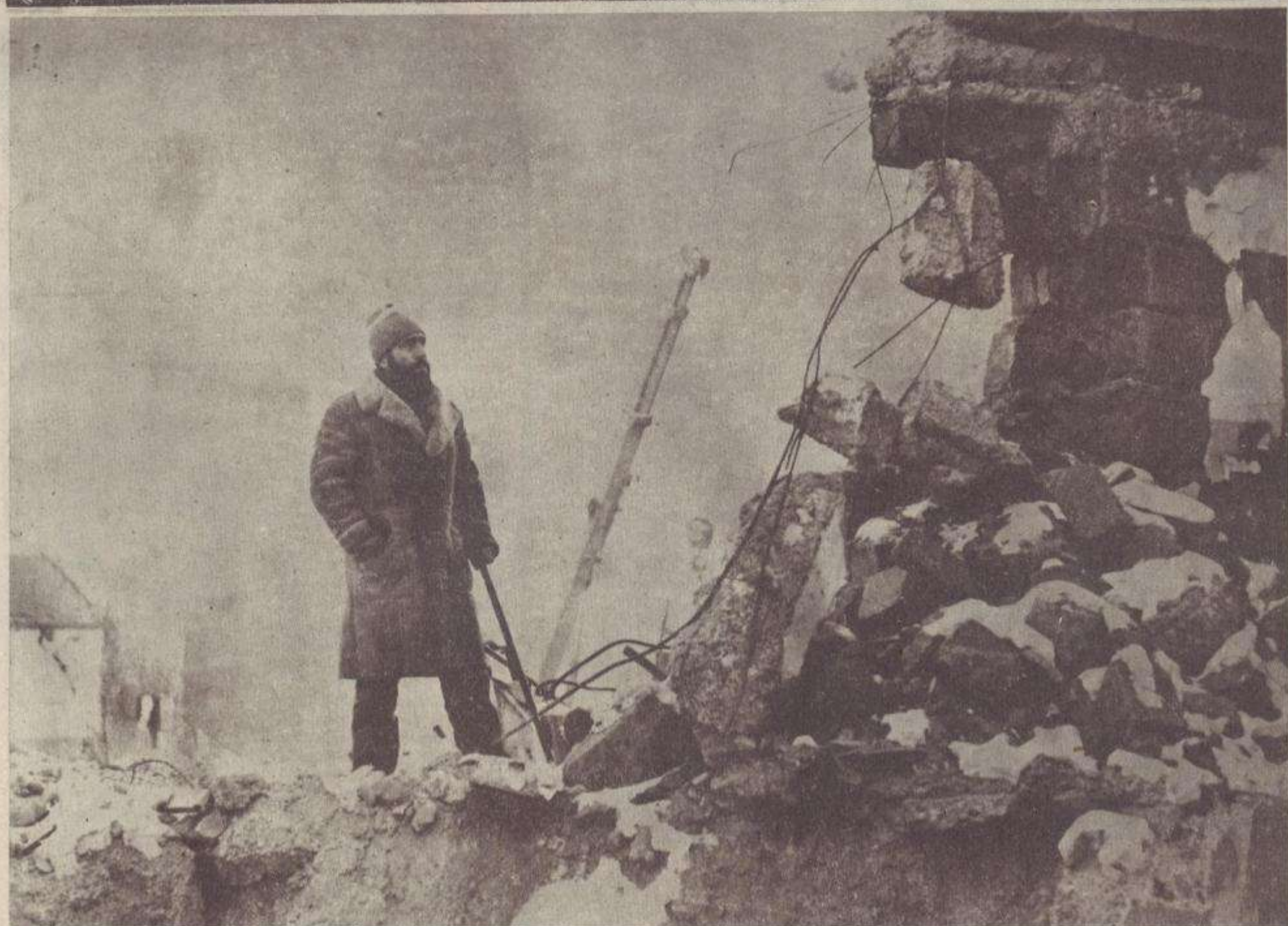
Գուլպեղենի ա/մ գործող-թողարկող սրտադրամասի փլատակները...