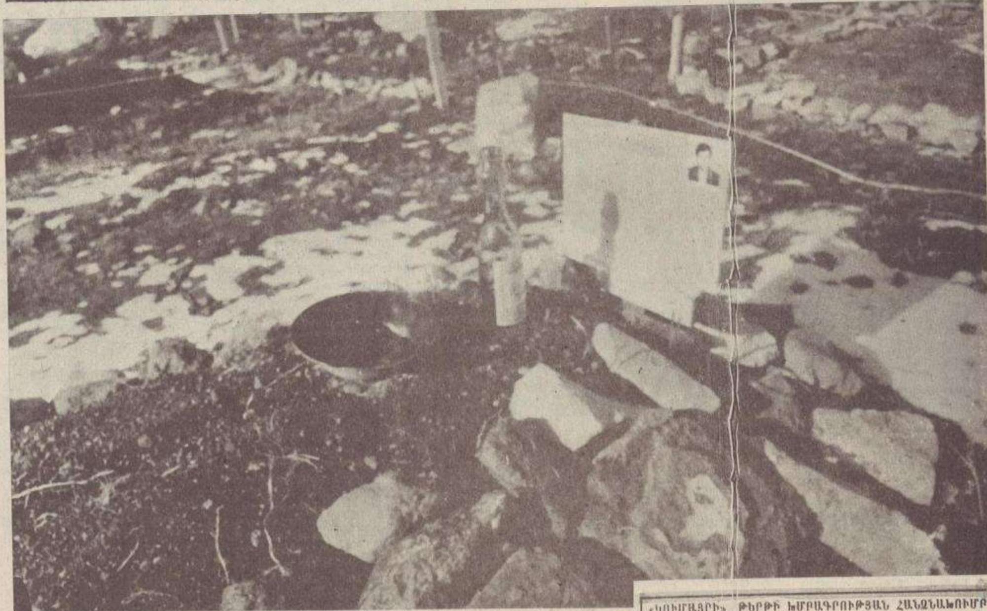
Լեհիստանի նոր գերեզմանատանը: