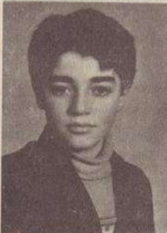
ՄԱՅՐ ԵՎ ՈՐԳԻ