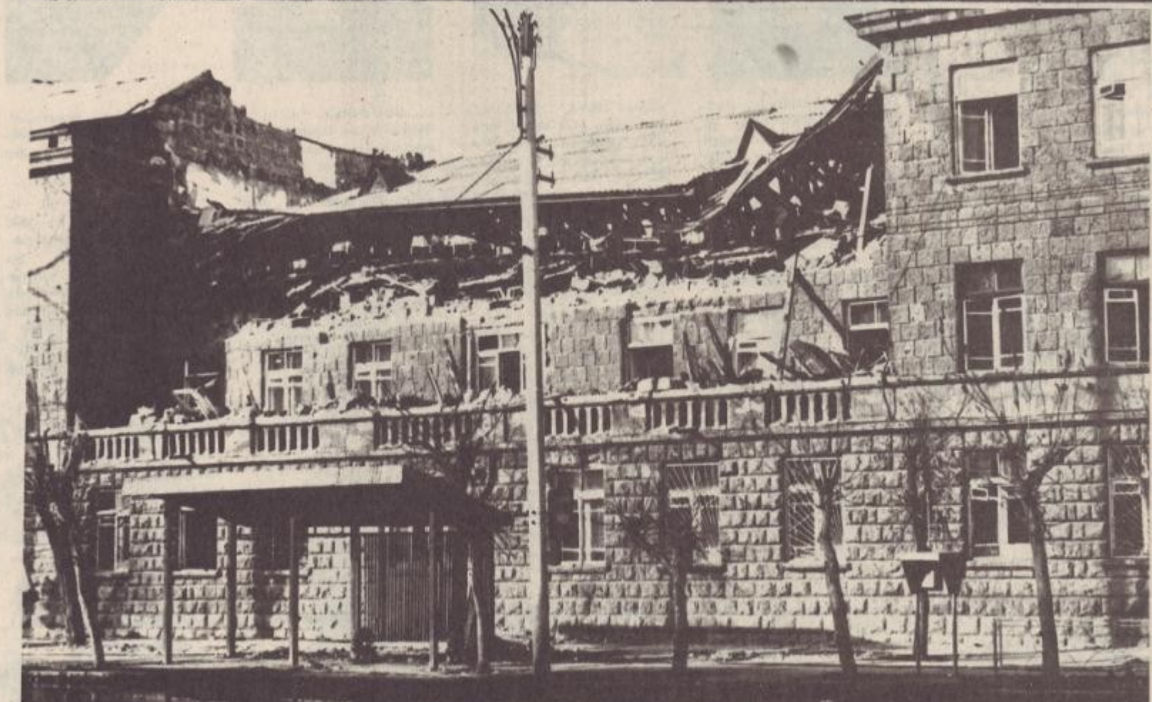
Չիկոլի անվան Թիվարդյանցի երկրաշարժից հետո: