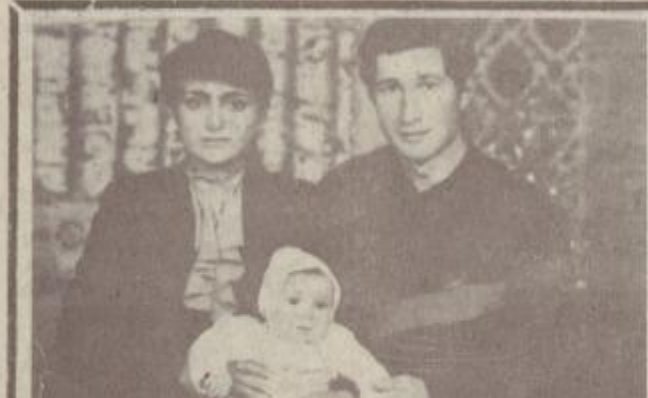
ՆՊԱՆՑ ԶԱՊՐԱՆՆԻ ԶԱՄԻՆԵՐԸ