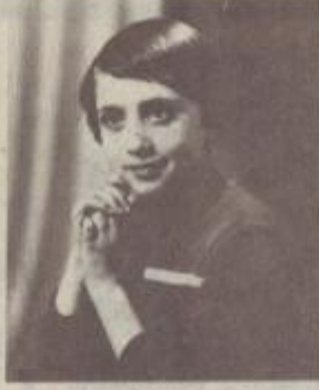
Էր հատկապես քեզ հանդիպելիս։

Միքնի ժամանա, 2,5 տարի է անցել, մենք չենք համարվում մահվանի հետ, չենք հավանում, չենք հավատում։ Որքան սարսափելի է ըստ պատմում ենք... Այս սպառնալից հանգիստով, նույնիսկ հույսով... Ի՞նչ անհեթոթություն է ինչ իրավունքով, ինքներս էլ չզգտեմք։ Մեր գլխերը, որ սա խարկանք է։ Մենք փրկում ենք աչքերով քեզ, մեր լսելիքը ծարավի է քո ձայնին։ Ահա, ինչպե՞ս հաշտվեցի։ Մեզ այնու չի ծփա ուրախության այիքը, որ փոթորկում