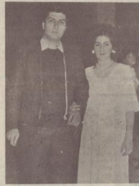
ԵՎ ԿԵՐԱՆՍ ՄՆԱՅ...

— Աստված չամի էլ օրերը հետ դատման... Ամեն երեկո, երբ իրիկոնն էր մեղմիկ իջնում, նա քննույց տեսչ տեր։ Աստուծոյ յաղաղաբայուն էր աղերսում աշխարհին, երջանակ ու հանգիստ կյանք՝ մարդկանց։ Եվ որքան արեց էր անխիղճ լինել և որքան չարանարտ էր ճակատագիրը, որ այդ վախեցած, քարի ու իմաստուն աչքերի համար ցույց / տվեց դանթեական մի դժոխք, որին կույ զնային աղչիկը՝ Ժամանակ ու Հասմիկ թոր։